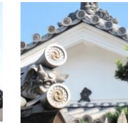
田守家・鬼瓦・しょうきんさん