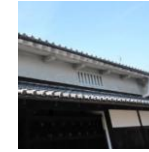
南奥谷家虫籠窓・うだ、背割り水路