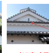
杉田家・鬼瓦・しょうきんさん