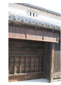
木口家 虫籠窓 あげみせ