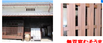
無双窓むそうまど